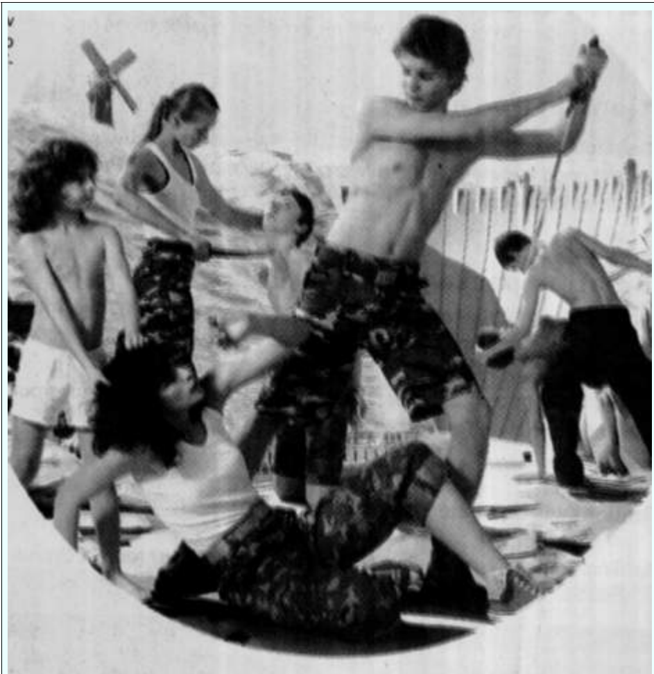
Έργο της ρωσικής καλλιτεχνικής ομάδας AES+F που παρουσιάστηκε το 2007.