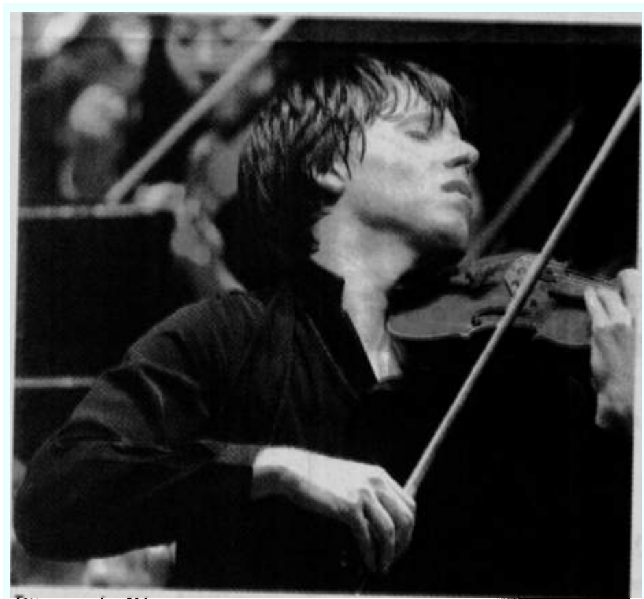
Τον περασμένο Μάιο ο κορυφαίος βιολονίστας Τζόσουα Μπελ διηύθυνε στη Λευκωσία το περίφημο σύνολο μουσικής δωματίου St. Martin in the Fields.