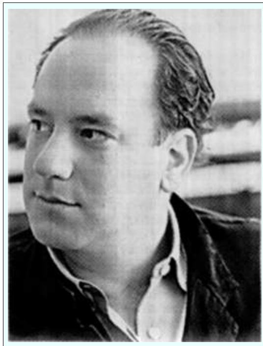
ΦΙΛΕΛΕΥΘΕΡΟΣ Δευτέρα, 1 Αυγούστος 2011, π. 28